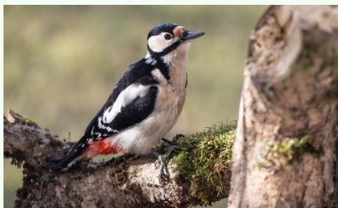
Buntspecht