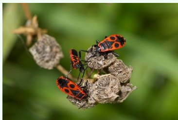
Gem. Feuerwanze