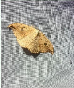
Heller Sichelflügler