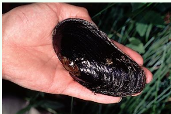
Flussperlmuschel

Die Flussperlmuschel ist ein ganz besonderer, hochgradig gefährdeter Bewohner unserer Fließgewässer. Im Projekt MARA arbeitet man an der Wiederherstellung naturnaher, sauberer Gewässer und stabiler Muschelbestände. Die Exkursion in die Muschelzuchtstation gibt Einblicke in das Nachzuchtprogramm, zeigt bisherige Fortschritte sowie bestehende Herausforderungen im Muschelschutz auf und erläutert die Bedeutung intakter Fließgewässer für den Menschen.