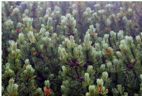
Latschenkiefer

Gemeinsame Veranstaltung mit dem Haus am Strom und Naturwissenschaftlicher Verein Passau