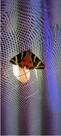
Russischer Bär

Für die Nachtfalterfauna im Auwald bei Uttigkofen (Gem. Aldersbach)