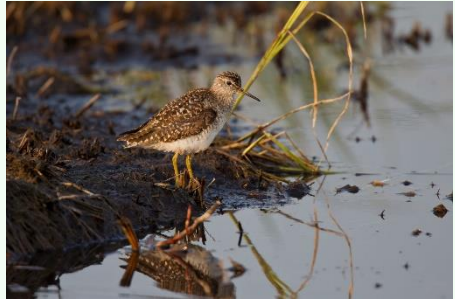
Bruchwasserläufer

Wenn im Frühjahr die Vögel zu singen beginnen, dann ist für uns Menschen der Frühling eingeläutet. So wunderschön der Gesang auch ist, für viele Menschen ist es ein Rätsel, wer hinter den einzelnen Stimmen steckt. Vielleicht ist darunter die ein oder andere Rarität. Die Veranstaltung ist eingebunden in die Aktion Stunde der Gartenvögel.